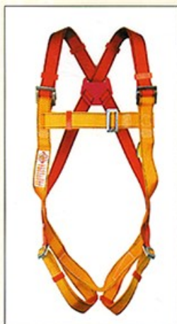
AB101 HARNAIS PRO 1 point d'ancrage antichute CE EN361

La qualité apportée à la fabrication des harnais PROTECTA, ainsi que leur ergonomie font référence depuis des décennies.