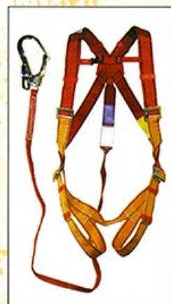
AB101/19 HARNAIS PRO "SCAFF" 1 point d'ancrage antichute longe antichute 2m CE EN361 & EN355