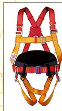
AB105 HARNAIS PRO 3 points d'ancrage antichute 2 points "D" de maintien CE EN361 & EN358