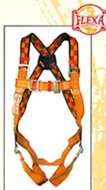
AB113E HARNAIS PRO FLEXA 2 points d'ancrage antichute CE EN361