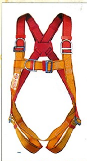
AB112 HARNAIS PRO 4 points d'ancrage antichute CE EN361