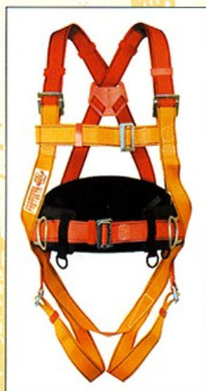
AB104 HARNAIS PRO 1 point d'ancrage antichute 2 points "D" de maintien CE EN361 & EN358