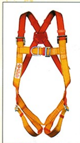
AB113 HARNAIS PRO 2 points d'ancrage antichute CE EN361